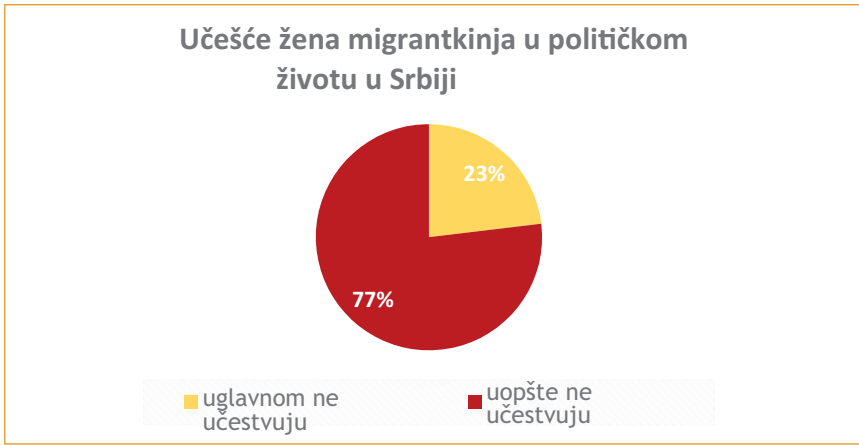
Grafikon 1. Ocena učešća žena migrantkinja u političkom životu u Srbiji

Prema njihovom mišljenju nedostaje učešće žena migrantkinja/traziteljki azila u javnom i političkom životu (Grafikon 1).